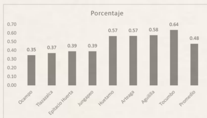
Gráfica 1 Relación Gasto Corriente / Gasto total (sólo municipios en los extremos)

eficientes, ocasionando que a nivel federal se recaude la mayor parte de los recursos. Esto ha llevado a los gobiernos locales a depender casi en su totalidad de los recursos provenientes de las transferencias federales, presentando graves problemas de autonomía financiera, así como grandes ineficiencias en