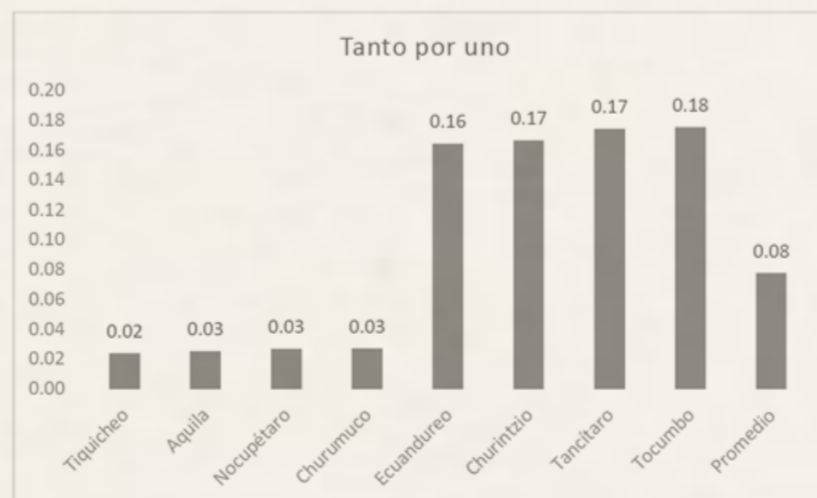
Gráfica 3 Ingresos propios / Ingresos totales